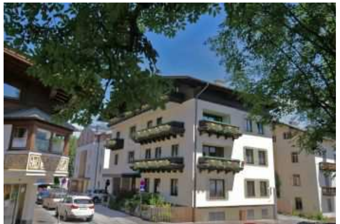
小奇麗になった現在(2018年)のペンション アンドレア

小さな街なので宿探しも楽だった。街 の中心から少し入った所に、いかにもチ ロル風の大屋根が、なだらかに傾斜す る3階建てのペンションがあった。その 『アンドレア(Andrea)』に入り交渉。 ところが、今日初めて通貨オーストリア ・シリングを使う国に来たので、肝心の 宿代が高いのか安いのかで戸惑ってしま った。宿のおばちゃんに「それが安い のか?」と尋ねると、「安い!」との返事。 それから計算しなおすと、朝食付きで 日本円にして4,000円もしないことに 気づき、「一泊よろしく」ということにな った。現金のみの前払いとなる段にな り、そのシリングがないことに気づく。 やるのが後手だった。「両替所はどこ にあるか?」と聞くと、銀行は閉まっ ているので、「グランド・ホテルに行っ て」と言われた。湖側に5分だと言 う。部屋に荷を置き外に出た。振り返 ると、チロルの民家風の建物。各窓に はフラワーボックスがあって、ゼラニ ウムの素直な赤色が建物に華を添えて いた。