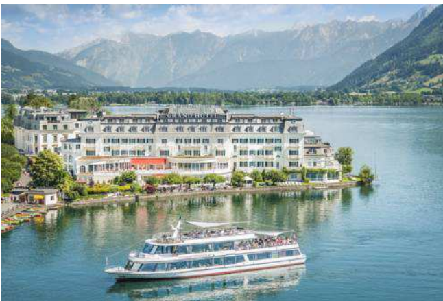
湖に突き出たグランド・ホテル。背景にはベルヒテスガーデンの山々

宿のおばちゃんと違って、丁寧な対応をしてくれた。両替を待つ間に、新聞が並ぶ棚の目立つ所に Dagens Nyheter (ダーゲンス・ニヘテル) が置いてある。中身は読めないが、それがスウェーデンの新聞であることを知っていた。現金が渡される時、「なぜ、スウェーデンの新聞が置いてあるのか？」と聞いてみた。曰く、「このホテルには、夏になると、北欧スウェーデンの金持ちが多く来られます」とのこと。今回の旅の初め、チューリヒで開催されていた、ノルウェイの美術展を見た。どうもこうした中欧の山国と北欧とは、ともに寒冷な地として共通したものをもっているのでは、と思ったりした。