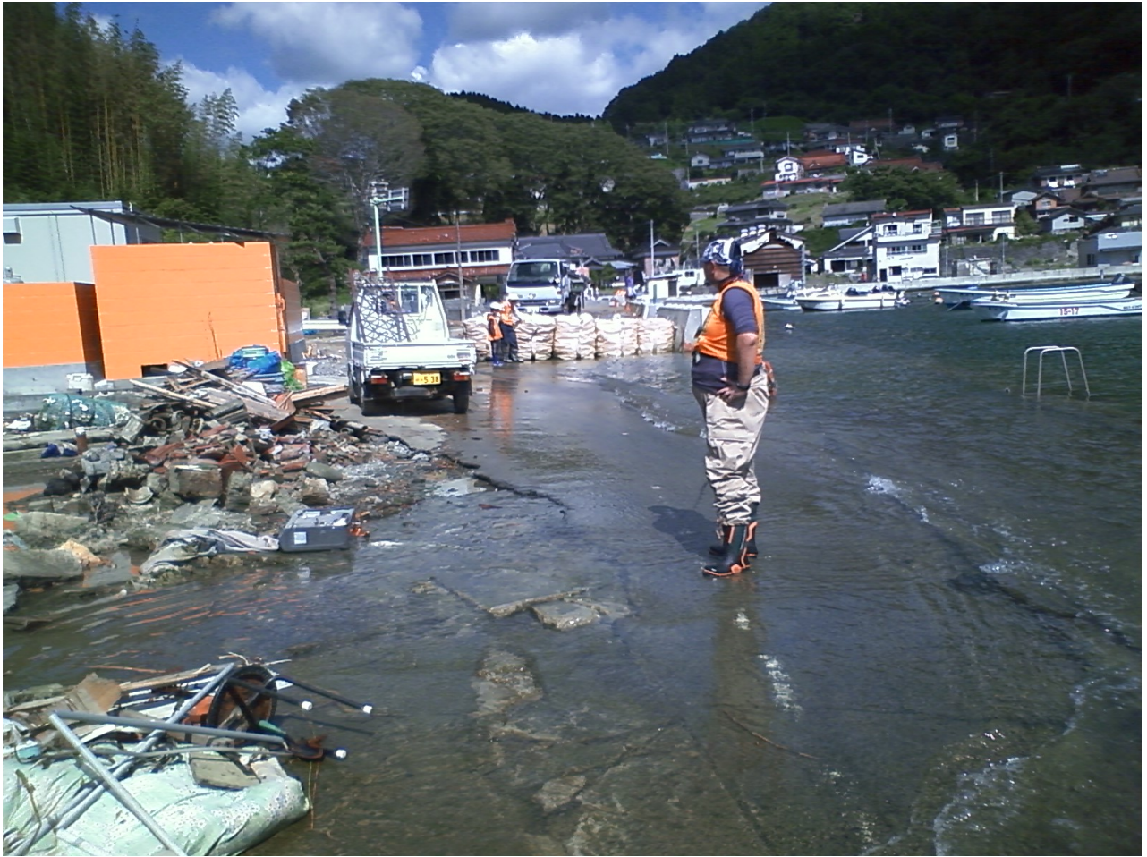
写真1 地盤が下がり海水が迫る鮪立の集落 午後の作業現場で

側、鮪立という集落だった。港に下りる手前の交差点で、この日ボランティアに参加する団体が一堂に顔を合わせた。RQの他に日本財団、天理教団などが参加していた。まずは水際まで沈んだ岸壁添いの道路に面する、津波を被り全壊した民家の後片付けだった。廃材の多くはその重さで沖に流されなかった瓦で、これらを敷地から道路際に出して積み上げ、ゴミ出しの車が来るのを待った。どうやら一段高い隣の敷地の瓦も、ここに溜まっているらしく、いくら撤去してもまた出てくるほど大量にあった。