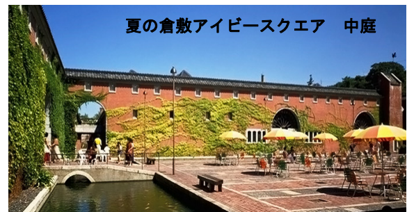
夏の倉敷アイビースクエア 中庭

家だった。「倉敷紡績(現クラボウ)」は、その後明治大正昭和を通じ、日本の花形の輸出企業として、この地を拠点に発展して行った。