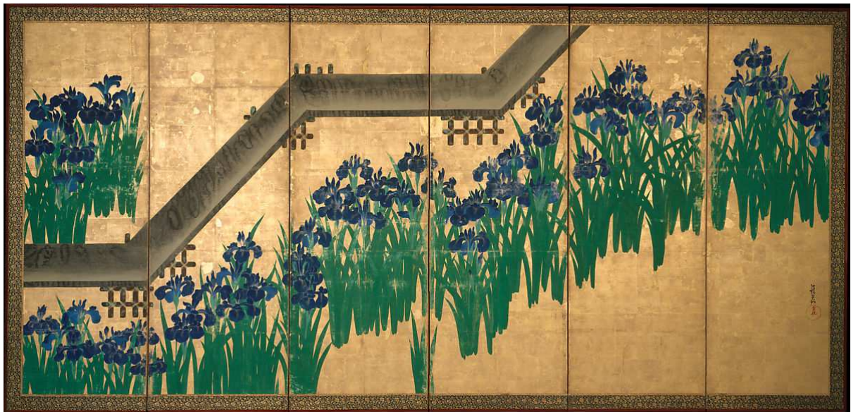
尾形光琳 八橋図屏風

さて、常設展示ではなかったため見て来られなかったが、日本美術としては、琳派の蒐集(しゅうしゅう)が有名らしく、尾形光琳の『八橋図屏風』一雙もそのコレクションにあるそうだ。琳派の祖である光琳の作品はどれを見てもその端正な趣に心魅かれる人が多いと思う。この作品も同様だが、不思議なのは、あやめの花咲く水辺を見下ろすアングルで描かれているが、その池に渡された細長い木橋は真上から見たように平板に描かれている点だ。写実性と、それとは相いれぬ様式美が混在している作品だった。せっかくだからと、同僚への土産にこの作品のポスターをミュージアムショップで購入した。