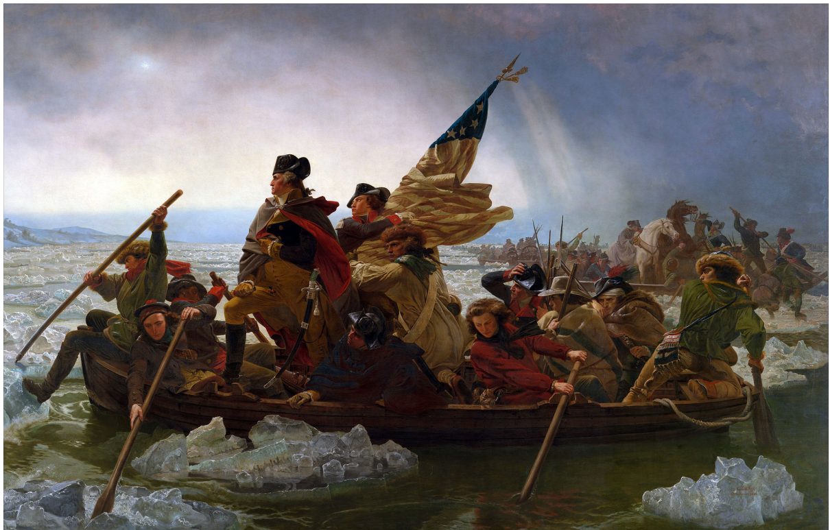
エマニュエル・ロイツェ『デラウェア河を渡るワシントン』

もう一つアメリカン・ウィングではどうしても見ておきたい絵画があった。それはとてつもなく大きな絵画だった。ドイツ系アメリカ人のエマニュエル・ロイツェが描いた『デラウェア河を渡るワシントン』である。風景画のジャンルでも、19世紀後半には絵画の大判化が進んだが、それに対抗するように歴史画の分野にも広がった。ウィング2階中央の部屋の正面に、この絵は掛かっている。横約6.5m、縦3.75mもの巨大な作品だ。独立戦争中の1776年の冬、ペンシルヴェニアに退避していたアメリカ軍を率いて、ワシントン将軍が州境の河を強行突破、ニュージャージー側にいた英軍の雇い兵を急襲して勝利したという英雄的行為を理想化したものだ。歴史画にしては、川に氷が張っていたか？と疑われたり、当時まだ制定されていなかった米国旗が用いられたり、不正確さは否めないが、とにかくこの大きさには圧倒された……。